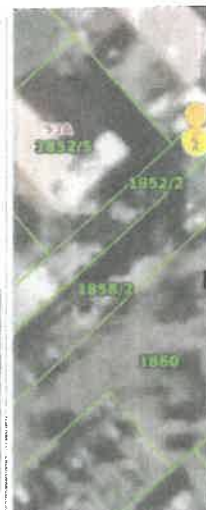
Slika 4 ID ZKC 263124 K. o. Maksimir