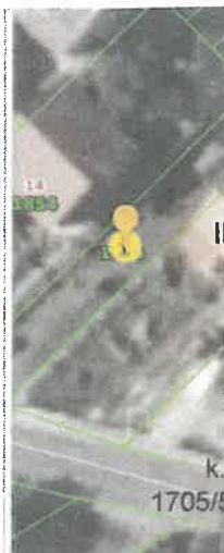
Slika 6 ID ZKC 260394 K. o. Maksimir

Adresa (lokacija) nekretnine: VIII Bukovački ogranak bb, 10 000 Zagreb