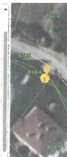
Slika 8 ID ZKC 2108575 K. o. Remete

PREUZETO OD PU GRAČANI - REMETE S - STAMBENA NAMJENA