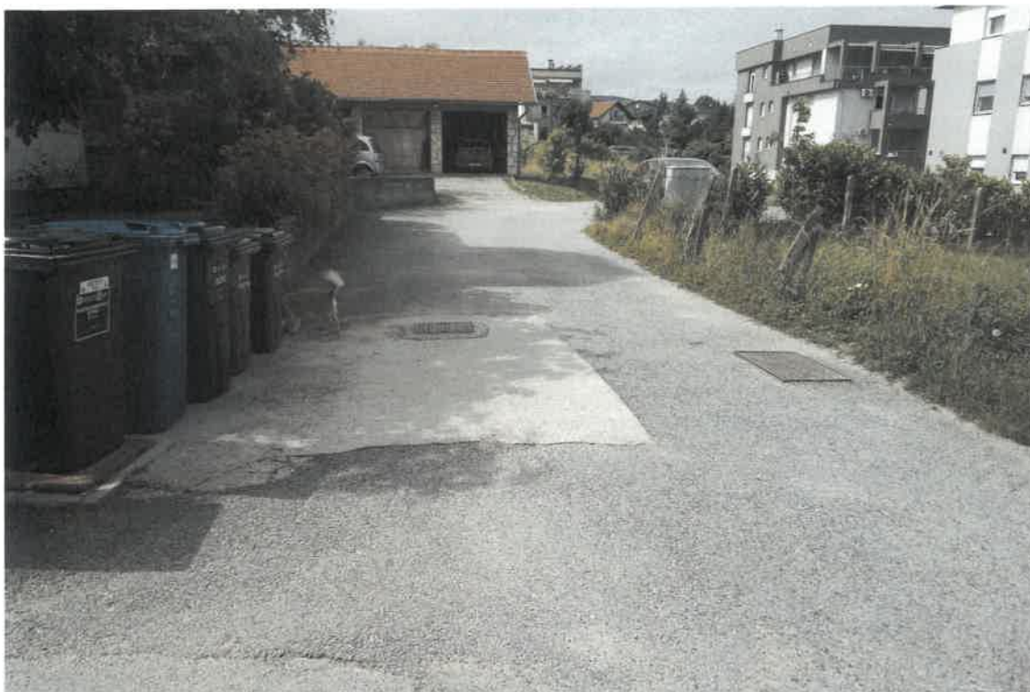
Slika 1 Pogled s nerazvrstane ceste na dio k. č. br. 2043/2 i 2048/4. U pozadini desno su kuće na broju 11 i 9. Vide se instalaciona okna, komunalni spremnici...