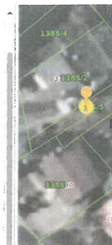
Slika 7 ID ZKC 903545 K. o. Remete

PREUZETO OD PU GRAČANI - REMETE S - STAMBENA NAMJENA