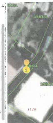
Slika 1 ID ZKC 260386 K. o. Remete

Status podatka PREUZETO OD PU Cjenovni blok BUKOVAC Pretežita namjena cjenovnog bloka S - STAMBENA NAMJENA