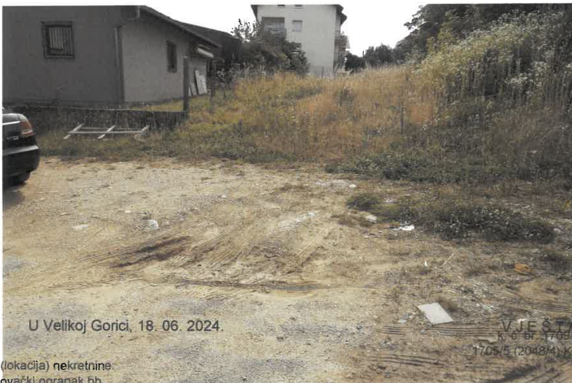
Slika 4 Sa susjednih kat. čestica oborinske vode i zemlja poplavljuju k. č. br. 2043/2.