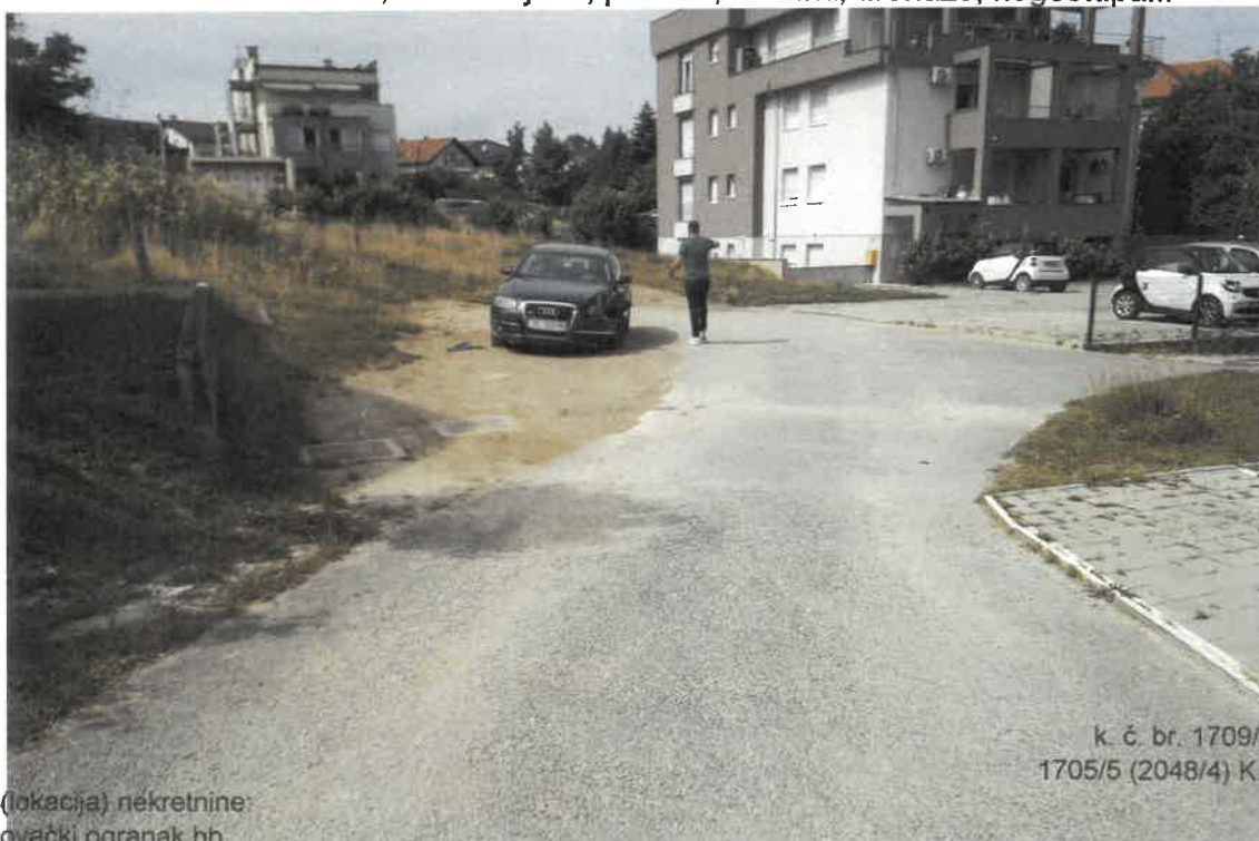
Slika 2 Slika dijela k. č. br. 2043/2. U pozadini je kućni br. 9. kolnik je neuredno izveden, bez rubnjaka, padova, slivnika, drenaže, nogostupa...

k. č. br. 1709/2 (2043/2) i 1705/5 (2048/4) K. o. Remete