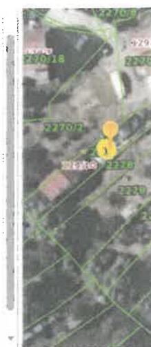
Slika 2 ID ZKC 500910 K. o. Remete

Status podatka PREUZETO OD PU Cjenovni blok BUKOVAC Pretežita namjena cjenovnog bloka S - STAMBENA NAMJENA