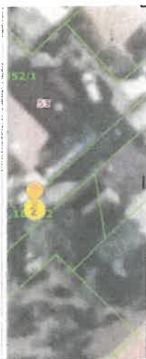
Slika 5 ID ZKC 842897 K. o. Maksimir