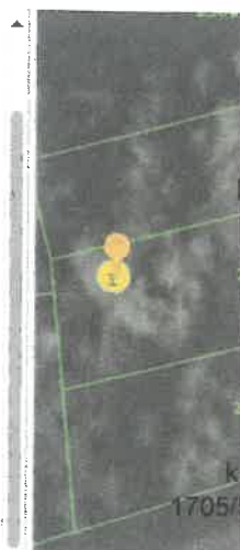
Slika 3 ID ZKC 951701 K. o. Remete

Status podatka EVALUACIJA U TIJEKU Cjenovni blok BUKOVAC Pretežita namjena cjenovnog bloka S - STAMBENA NAMJENA