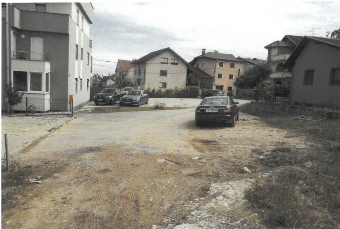
Slika 3 Pogled s k. č. br. 2038 prema jugu (nizbrdo). Pristup služnosti je neuredan s lošom izvedbom interventnog asfaltnog zastora.